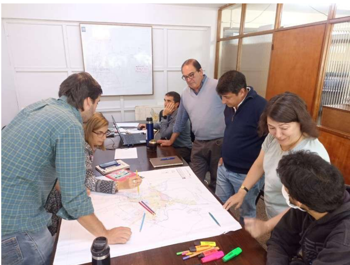
13/04/2023 – Reunión con agentes inmobiliarios