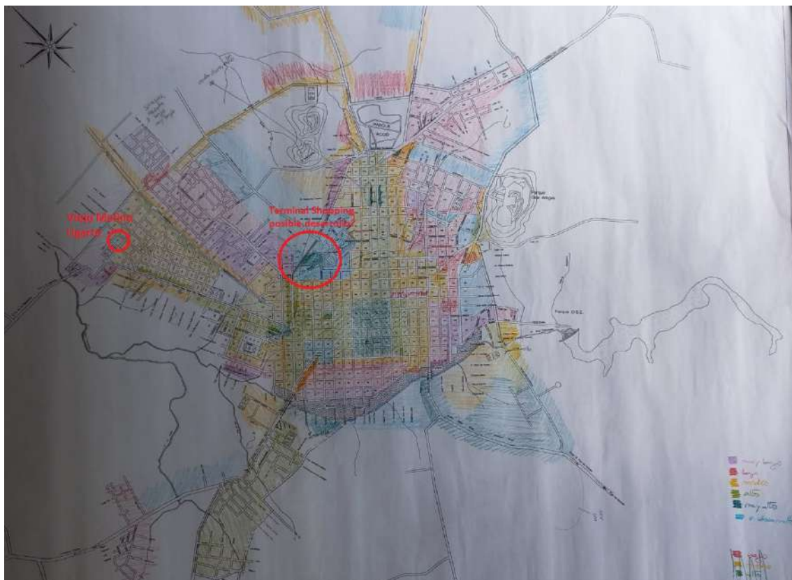
19/04/2023 – Reunión con desarrolladores inmobiliarios