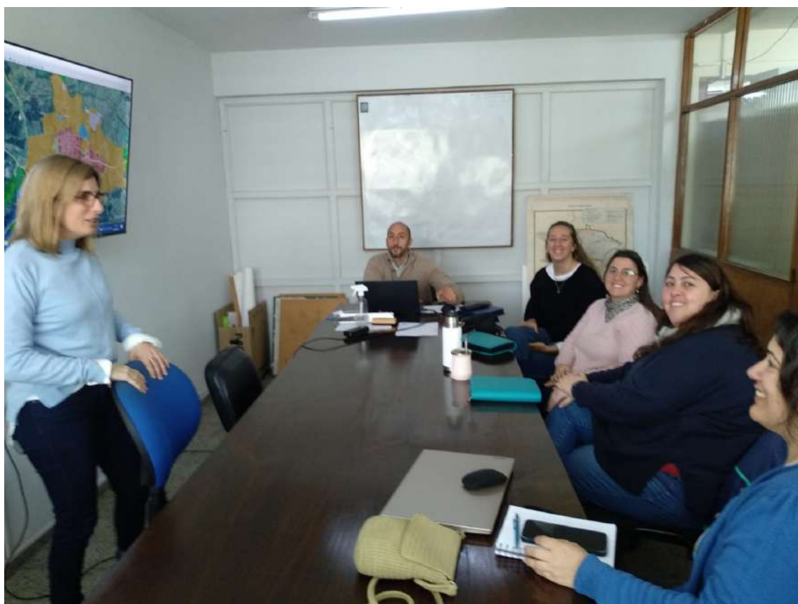
21/09/2023 – reunión con SAU Lavalleja