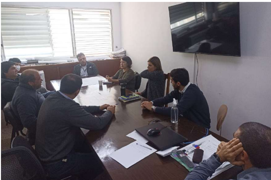
26/04/2023 – Reunión con empresas de transporte urbano de pasajeros